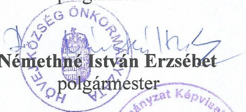
dr. Némethné István Erzsébet polgármester